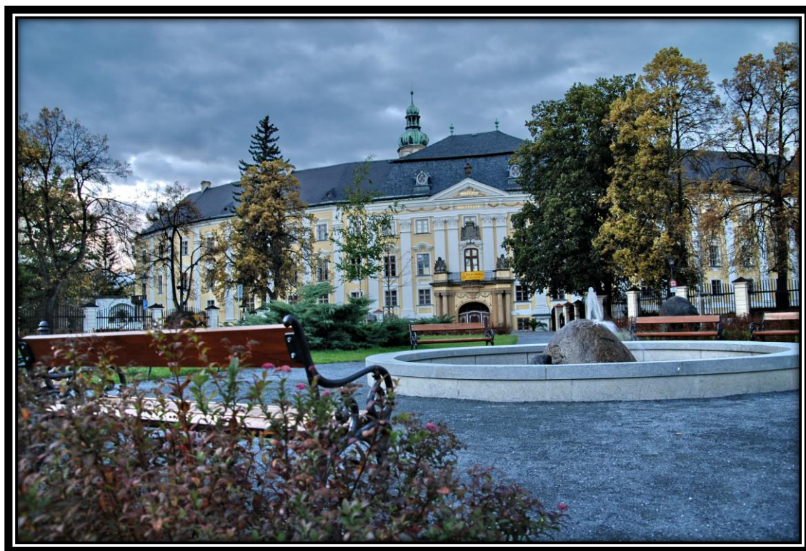
Foto z pohledu TPR v Bruntále.